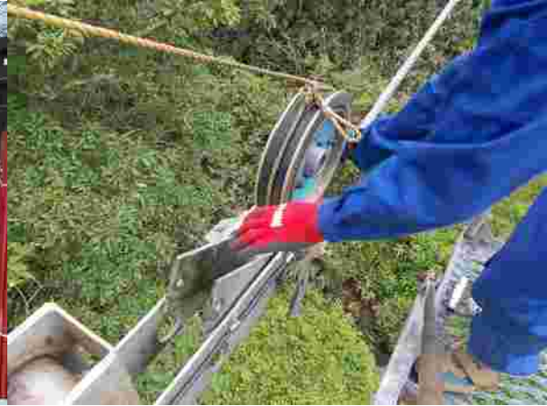
【第1ペアリフト索輪交換(H30.6.19)】