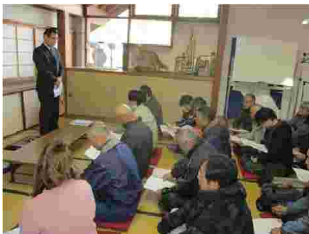
【安全統括管理者による訓示(H30.12.10)】

弊社では、シーズン営業開始前に施設及び運転取扱について、業務マニュアルに基づき安全教育を実施しております。