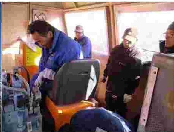
【予備原動操作訓練(H30.12.11)】