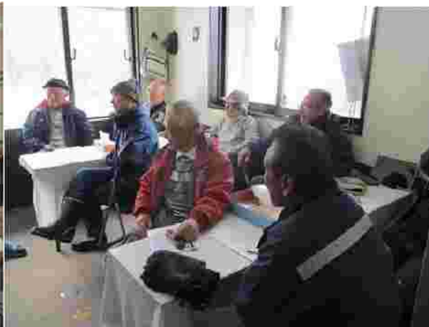
【社員安全管理教育 H30.12.12】