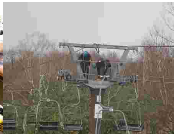
【メーカー定期点検(H30.12.14)】