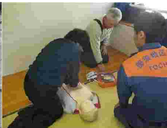
【消防署員を招いてのAED訓練(H30.12.21)】