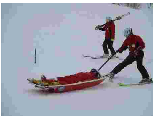
【パトロール救助訓練(H30.2.5)】