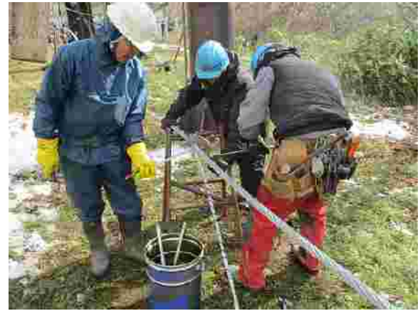
【第1ペアリフトケーブル交換(H29.10.30)】