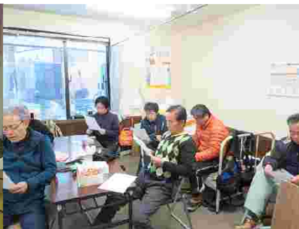
【社員安全管理教育 H29.12.12】