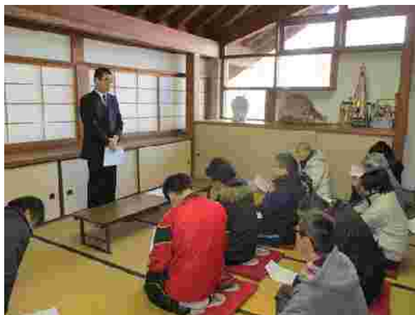
【安全統括管理者による訓示(H29.12.11)】

弊社では、シーズン営業開始前に施設及び運転取扱について、業務マニュアルに基づき安全教育を実施しております。