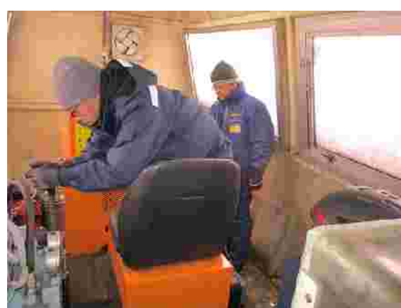
【予備原動操作訓練(H29.12.13)】