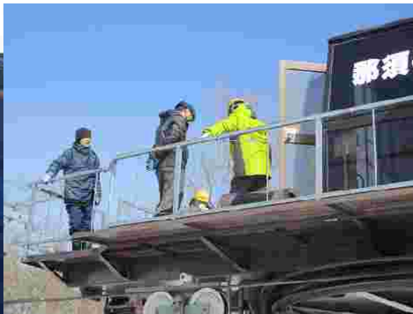
【メーカー定期点検(H29.12.14)】