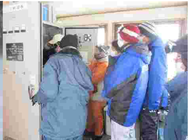
【始業点検・リフト運転操作訓練 ( R2.12.16 )】