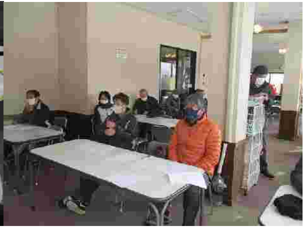
【コロナウィルス対策講習会(R2.12.18)】