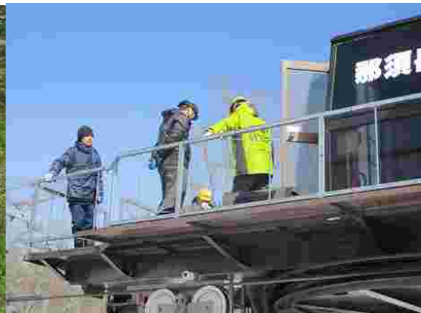
【メーカー定期点検 ( R2.12 月 R3. 1 月.2 月 )】