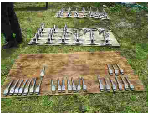
【搬器圧搾部分解・清掃 ( R2.6 月 )】