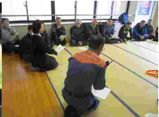
【消防署員を招いての AED 訓練 (R1.12.19)】