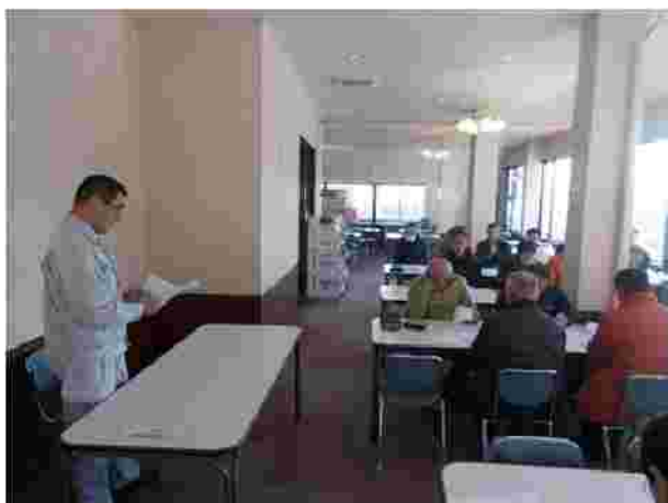
【安全統括管理者による訓示(R1.12.9)】

弊社では、シーズン営業開始前に施設及び運転取扱について、業務マニュアルに基づき安全教育を実施しております。