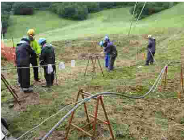
【第2ペアリフト ロープ交換 (R1.8)】