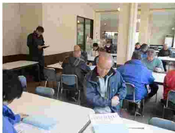
【社員安全管理教育 R1.12.9】