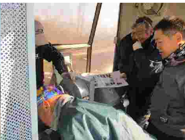
【予備原動操作訓練(R1.12.11)】